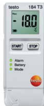
testo 184 T3