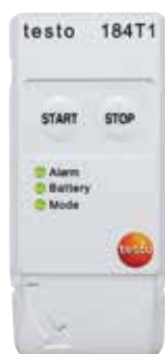
testo 184 T1

Обзор линейки логгеров данных testo 184.