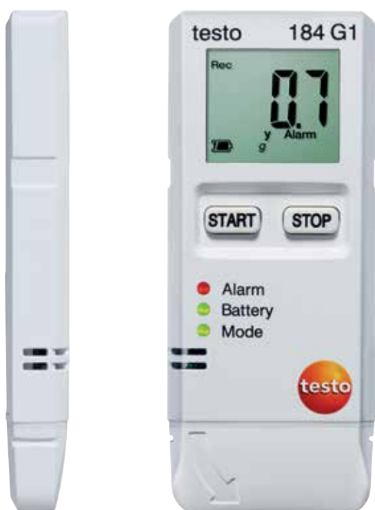
Реальный размер прибора

Все преимущества логгеров данных testo 184 с первого взгляда.